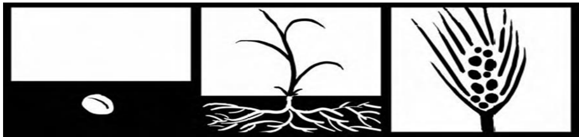
ប្រភព ៖ (ALAN CRAWFORD, WENDY SAUL, SAMUEL R. MATHEWS, AND JAMES MAKINSTER, 2005) Teaching and Learning Strategies for Thinking Classrooms

គុណភាពនៃការបង្រៀន និងរៀន គឺពឹងអាស្រ័យជាធំលើវិធីសាស្ត្របង្រៀន និងសមត្ថភាពគ្រូបង្រៀន។ គោល វិធីនៃការបង្រៀនមុខវិជ្ជាប្រវត្តិវិទ្យាគឺគោលវិធីរៀនបែបវិវិកល។ គោលវិធីរៀនបែបវិវិកល គឺបង្កើត និងពង្រីកការឆ្ងល់ ការសួរ ការអាន ការសរសេរ និងការស្រាវជ្រាវ ដើម្បីបំពេញចំណុចខ្វះខាតរបស់អ្នកសិក្សា ដោយដំបូន្មាន ដុសខាត់ និងពង្រីក វិជ្ជា បំណិន និងចរិយាដែលអ្នកសិក្សាមានស្រាប់ឱ្យទៅជាប្រាជ្ញាកិរិយាន៍តាមឧបនិស្ស័យ។